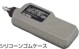
シリコンゴムケース 装着例