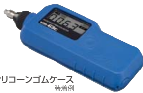
シリコンゴムケース 装着例