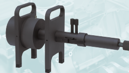
アコースティックダクト